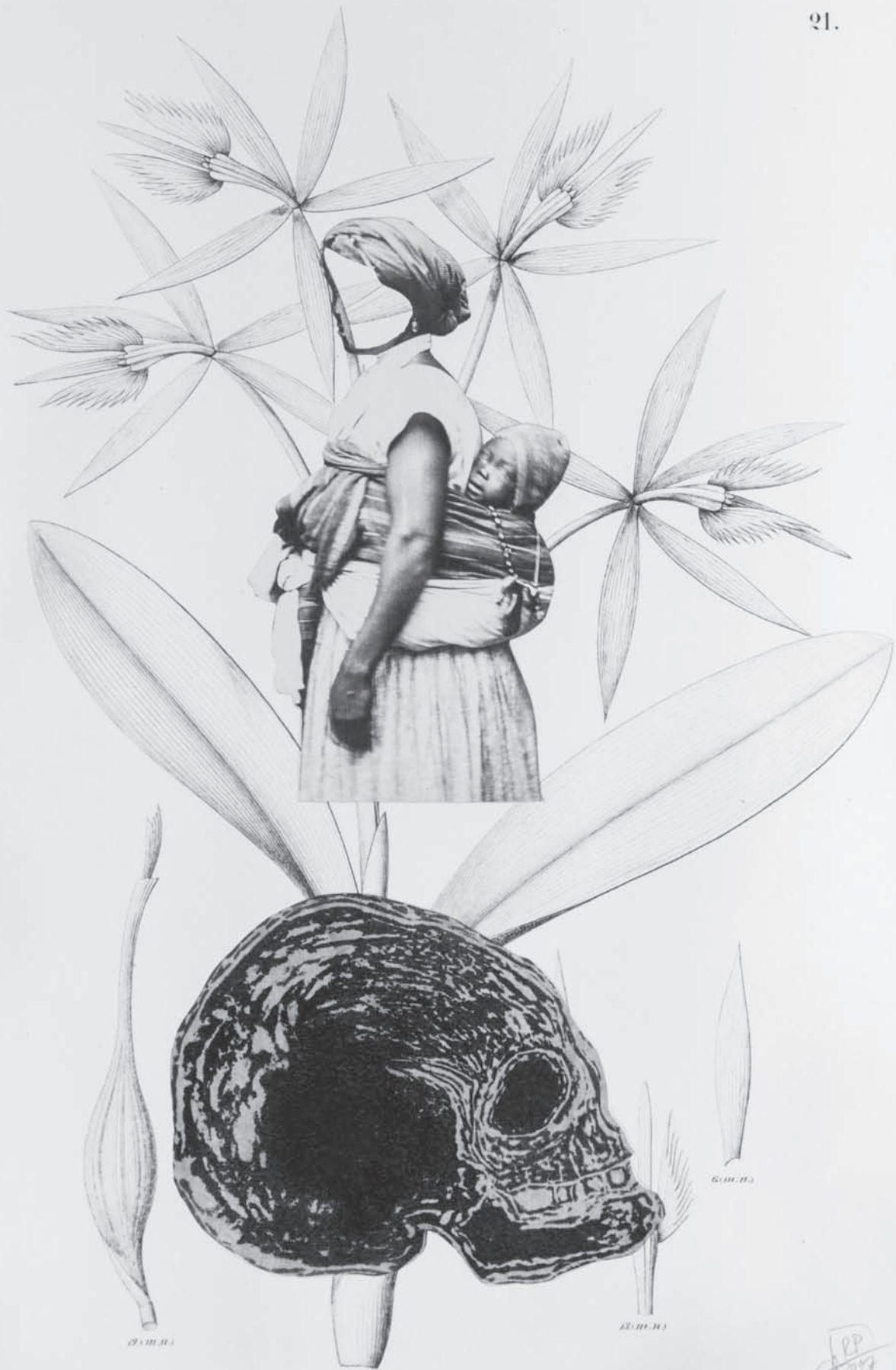
EPIDENDRUM ciliare var. cuspidatum.