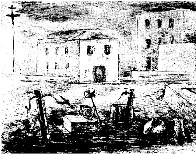
"Terreno Baldio", nanquim e aguada

O apego íntimo do artista às coisas, a força empática que as traz à tona, tão singelas e humanas, anunciam que também elas sobrevivem por si mesmas, carentes e desassistidas. O comércio entre homens e coisas parece ser o único vínculo afetivo estável neste universo onde faltam a comunicação entre os homens e a garantia da providência divina. Seria necessário descer até uma fenomenologia dos gestos e climas em Goeldi para apreender e analisar, por exemplo, a qualidade intrínseca dessa umidade tão carioca, quintessência tropical muito mais verdadeira afinal do que tantas alegorias de brasilidade. E esta autêntica osmose expressiva com a vida ao redor exclui, como supérfluos, detalhes e generalizações — tudo o que aparece é num sentido maior, mais intenso e essencial, do que nomes, adjetivos ou conceitos. A evidência plástica suprime, de saída, o discurso verbal. Isto é ainda mais admirável quando se sabe que a poética de Goeldi — dado comum a todo expressionismo — carrega forte acento literário. Apenas, o literário aqui se consubstancia de imediato na visualidade, não é acrescido a posteriori , muito menos premedita ou orienta a linguagem do artista.