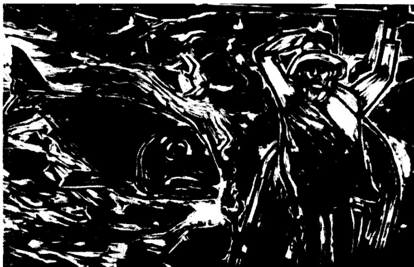
"Pescador Perdido", xilogravura