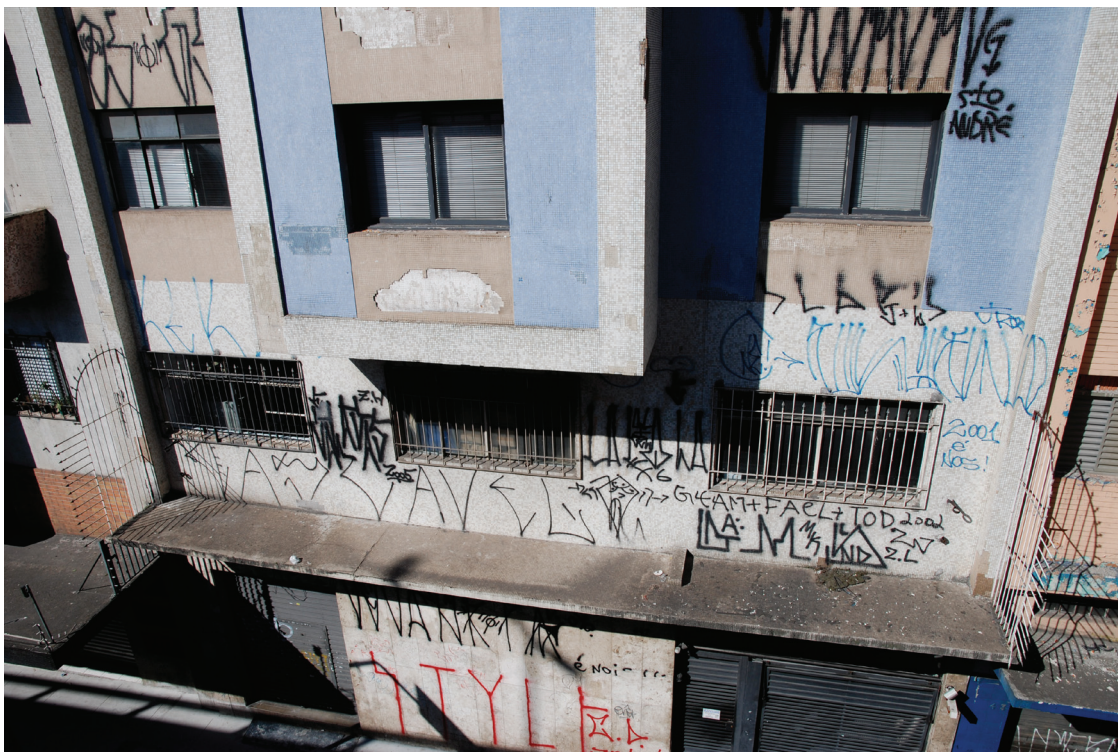
Figura 5: Pixação , 2010.