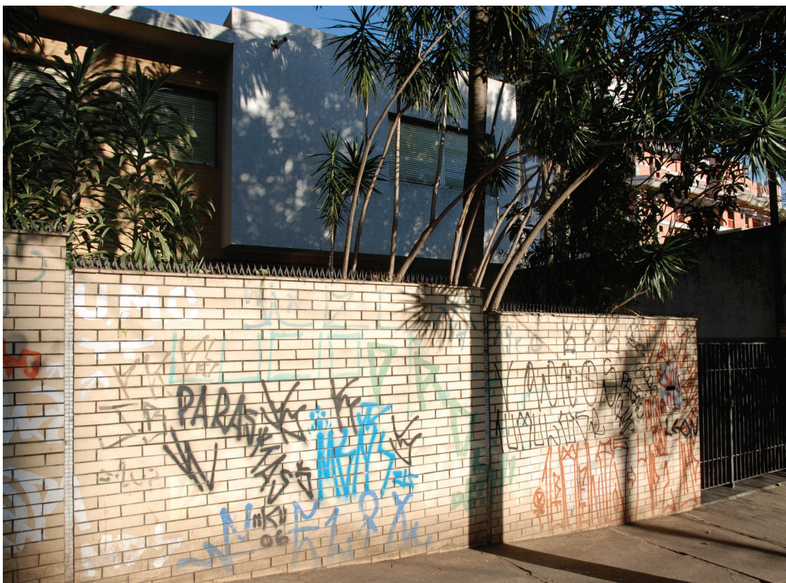
Figura 18: Pixações, 2009.