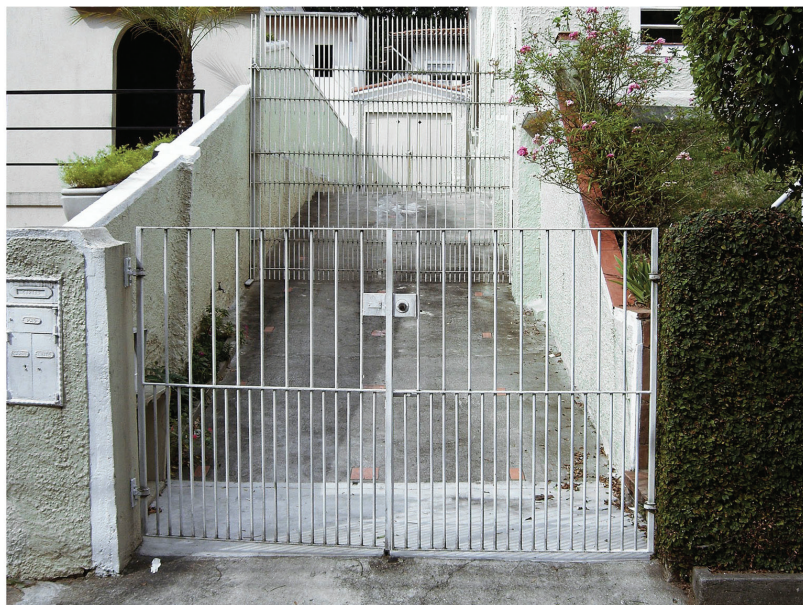
Figura 1: Cercas, 2008. Antoni Muntadas