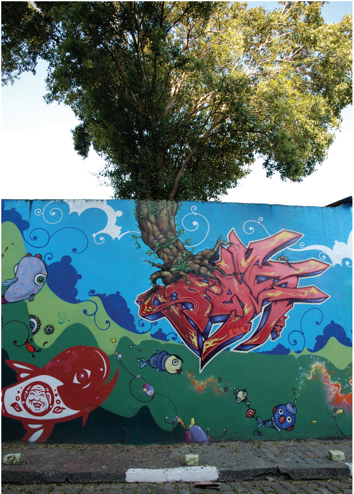
Figura 6: Grafite, 2008.