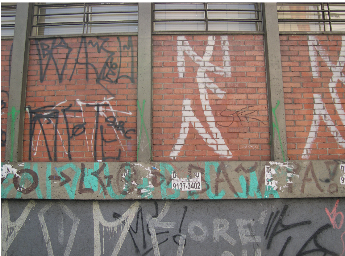
Figura 17: Pixações, 2006.