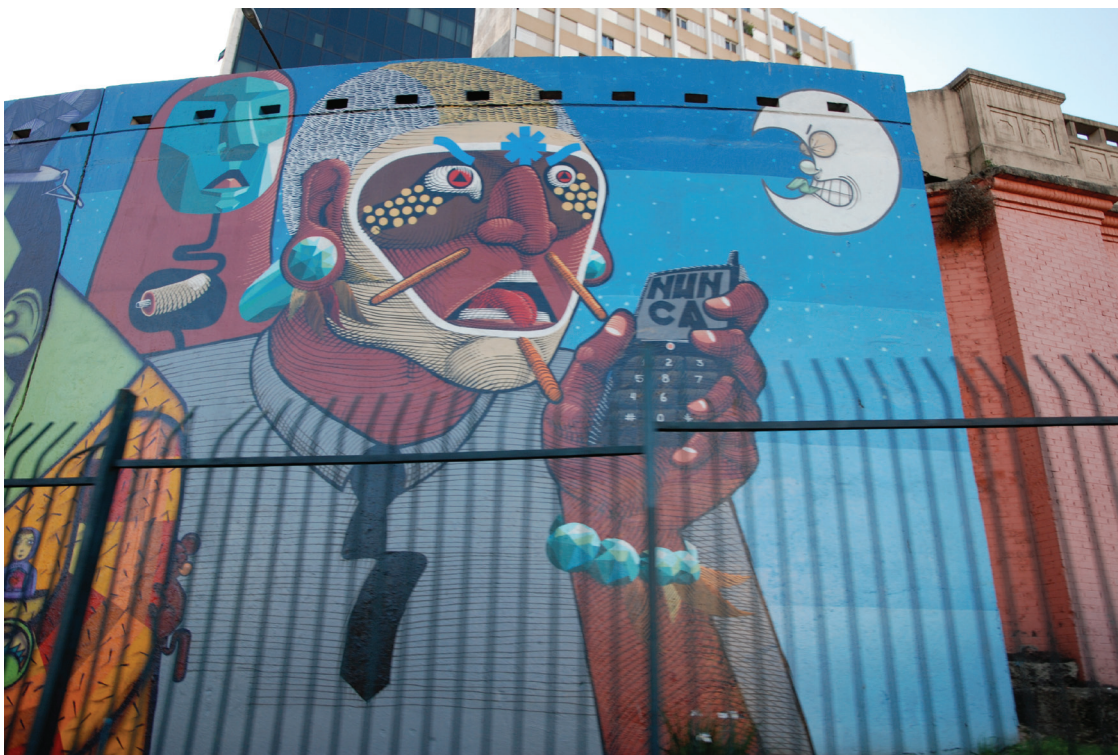
Figura 4: Grafitti, 2010. Teresa Pires do Rio Caldeira