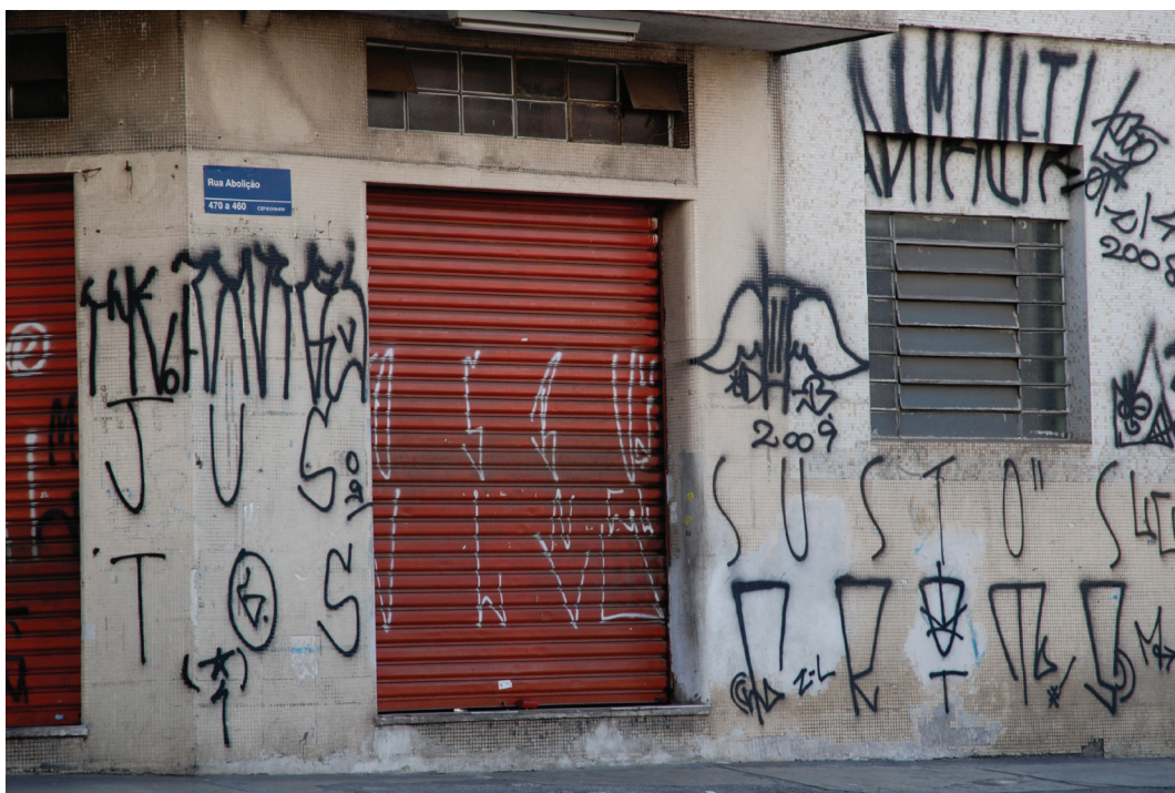
Figura 11: Pixações , 2009.