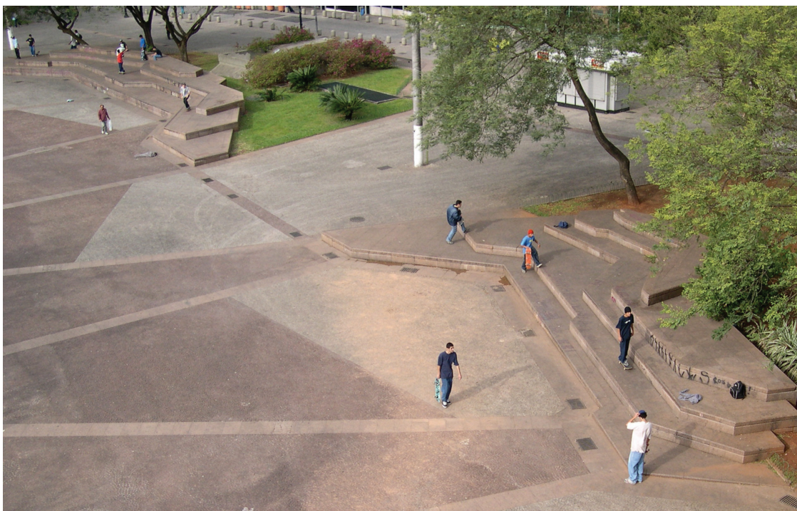
Figura 19: Circulações, 2009.