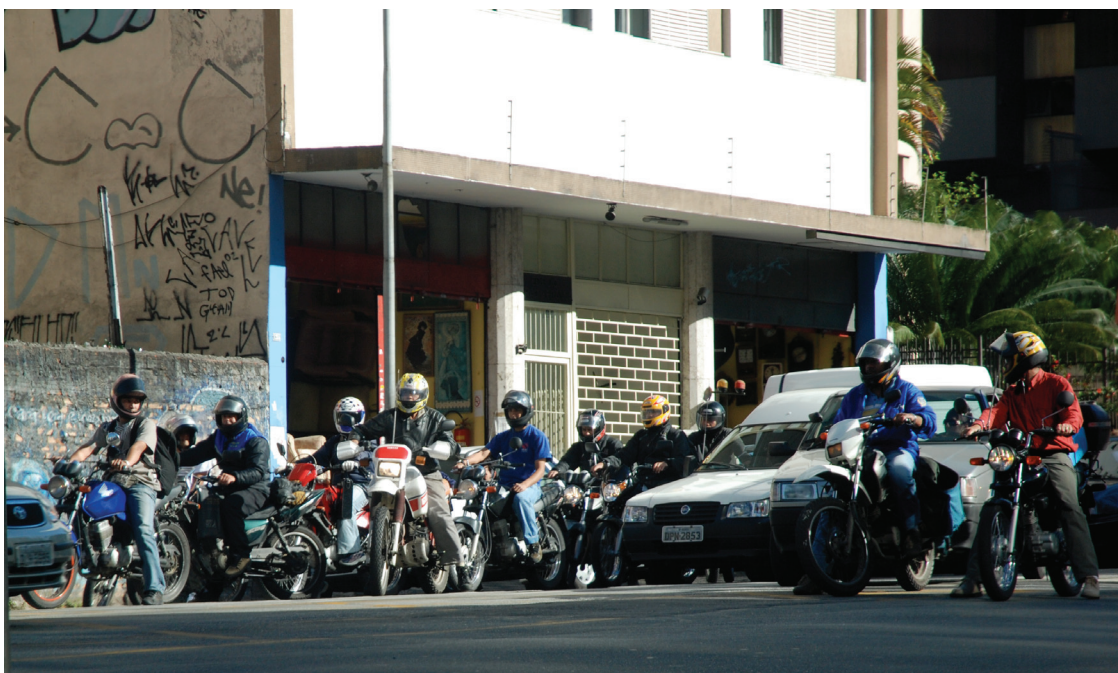
Figura 20: Circulações, 2009.