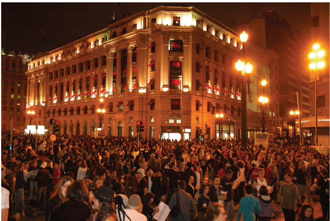
Figura 15: Virada Cultural, 2009.