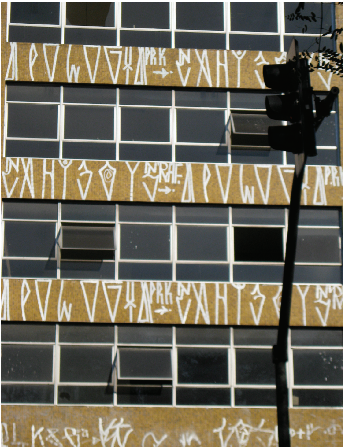
Figura 9: Pixações , 2008.