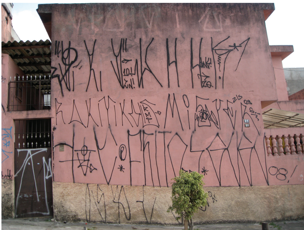
Figura 10: Pixações , 2010.