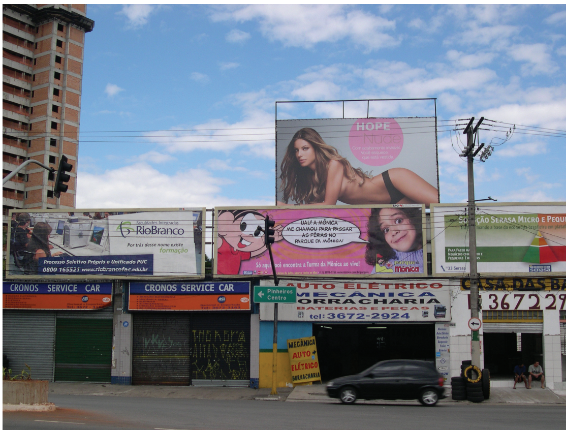
Figura 2: Antes da Lei da Cidade Limpa, 2006.