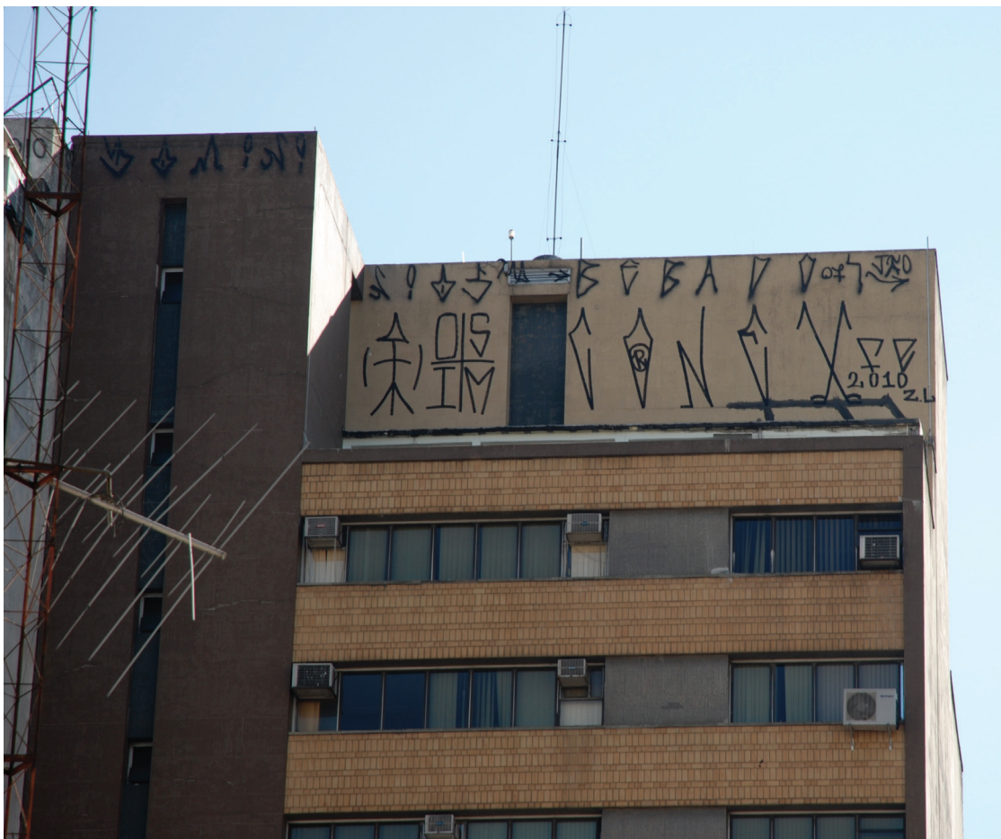
Figura 16: Duas pixações no topo de um prédio, 2010. Ambas são compostas de três partes. A superior inclui dois nomes – “Dominios” (a partir da extremidade esquerda do prédio) e “Bebados” –, seguidos da assinatura do autor (Jão) e da data (07). A pixação inferior exhibe o logo da grife Os Mais Imundos (O, S, M, I), e depois o nome da turma (Conex), a assinatura do autor (Fe), a data (2010) e as letras ZL (Zona Leste), a região originária dessa turma.