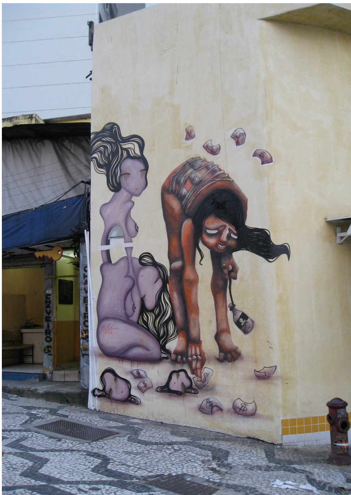
Figura 7: Grafite, 2010.