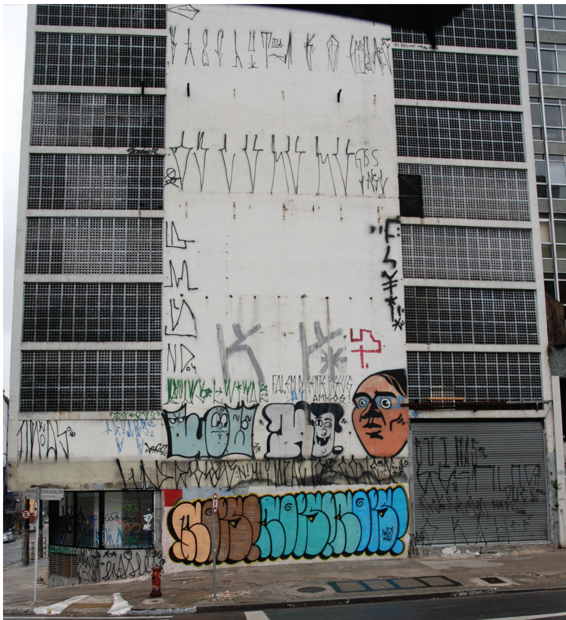
Figura 12: Guerra de inscrições, 2009.