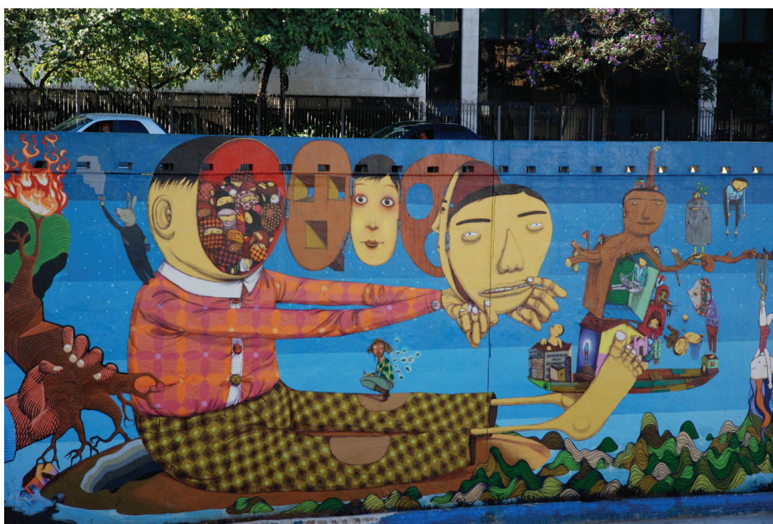
Figura 8: Grafite.