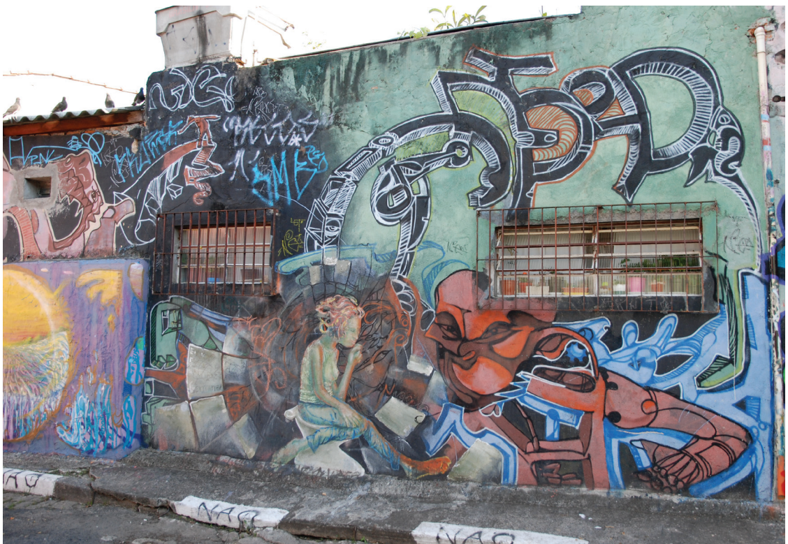
Figura 13: Agosto de 2008. “Atropelo” num dos mais famosos locais de grafiteagem, o beco do Batman, na Vila Madalena.