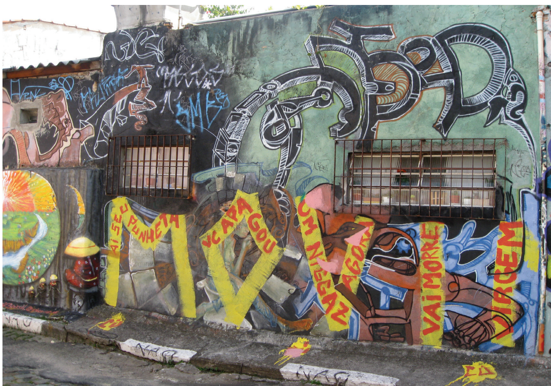
Figura 14: Dezembro de 2008